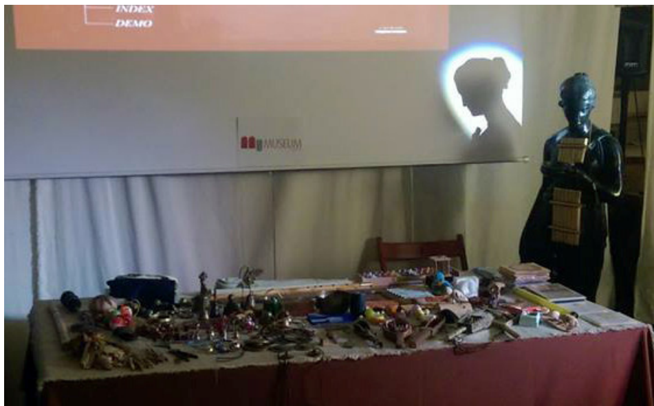
Napoli – Museum - 24 Aprile 2015