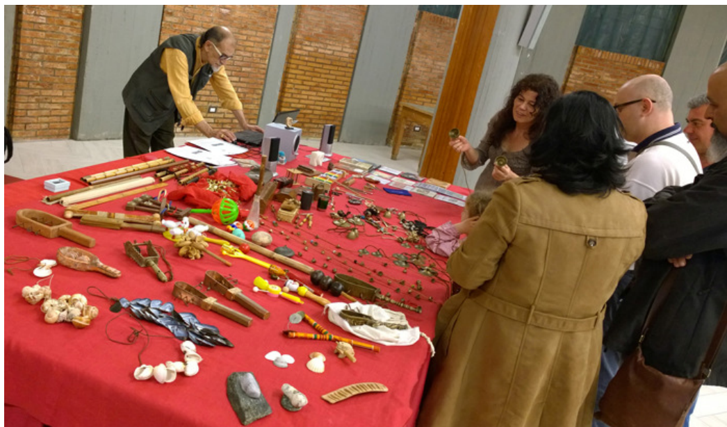
Dimostrazione IL POTERE DEI SUONI ACUTI - Castellammare di Stabia Vesuvian Institute - Fondazione RAS - 31 Maggio e 1 Giugno 2014