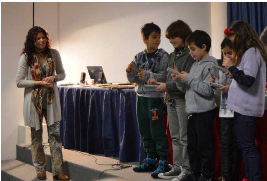
Il pubblico, dai bambini agli anziani, vengono coinvolti a suonare direttamente gli strumenti