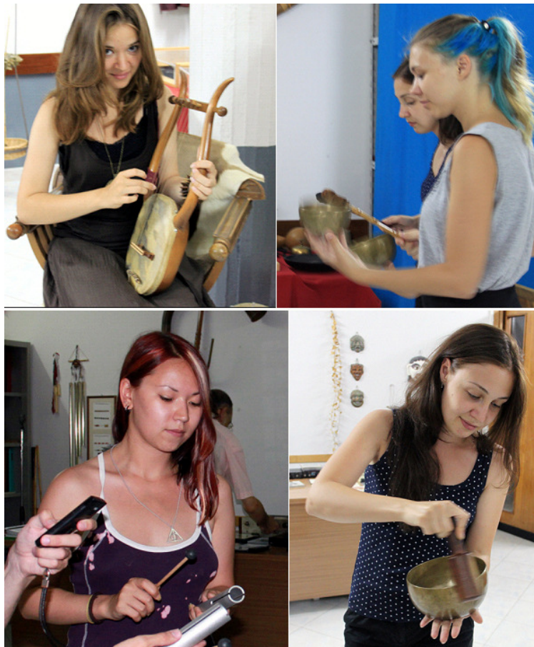
Castellammare di Stabia – Fondazione RAS – Agosto 2014 – Studentesse siberiane sperimentano direttamente lo strumentario dei Suoni Acuti