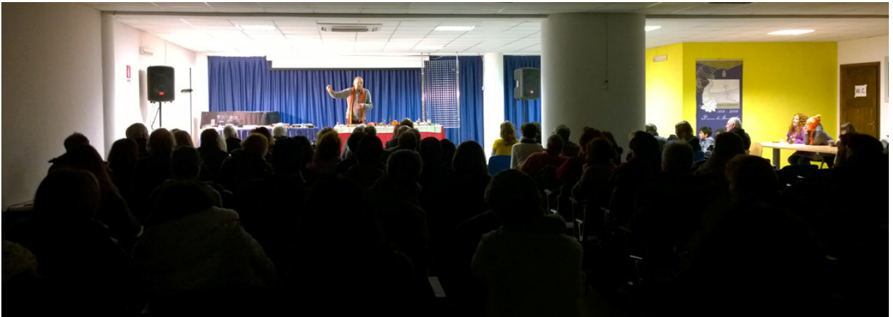
Piano di Sorrento – Centro Culturale Comunale – 22 Febbraio 2015