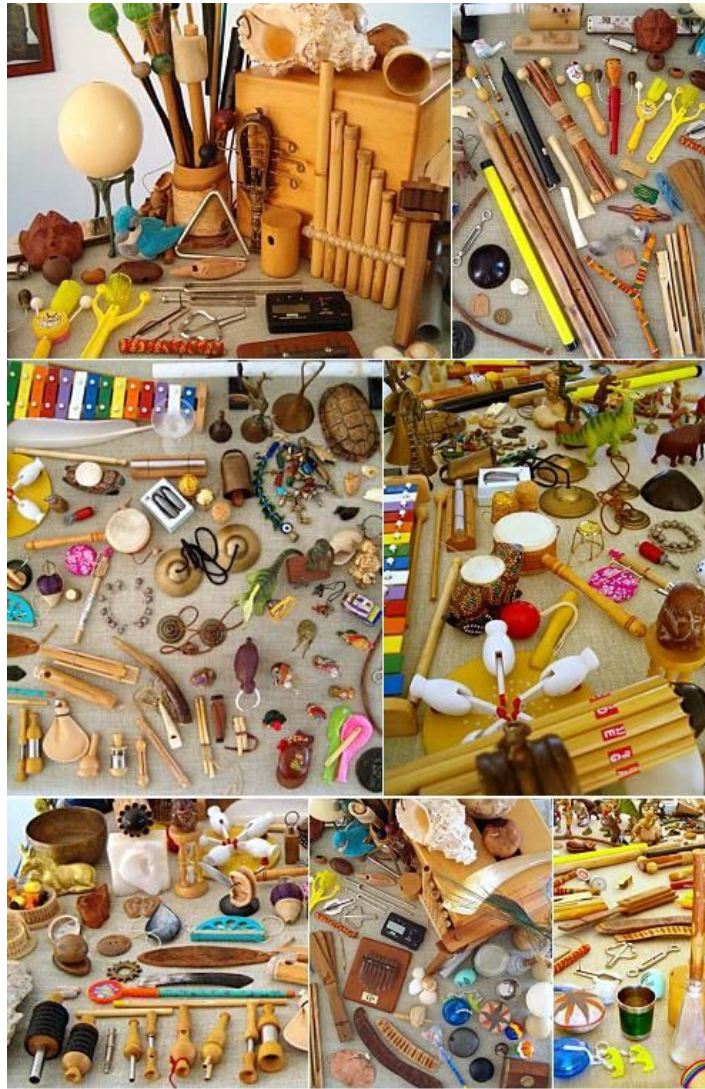
Parte dello strumentario impiegato per le dimostrazioni