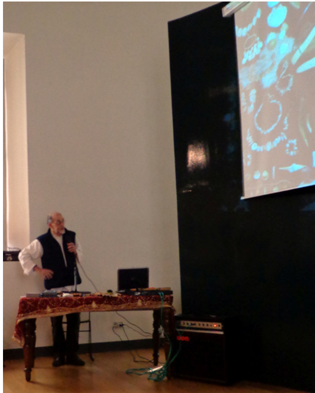
Milano – Antiquarium – 20 Aprile 2013